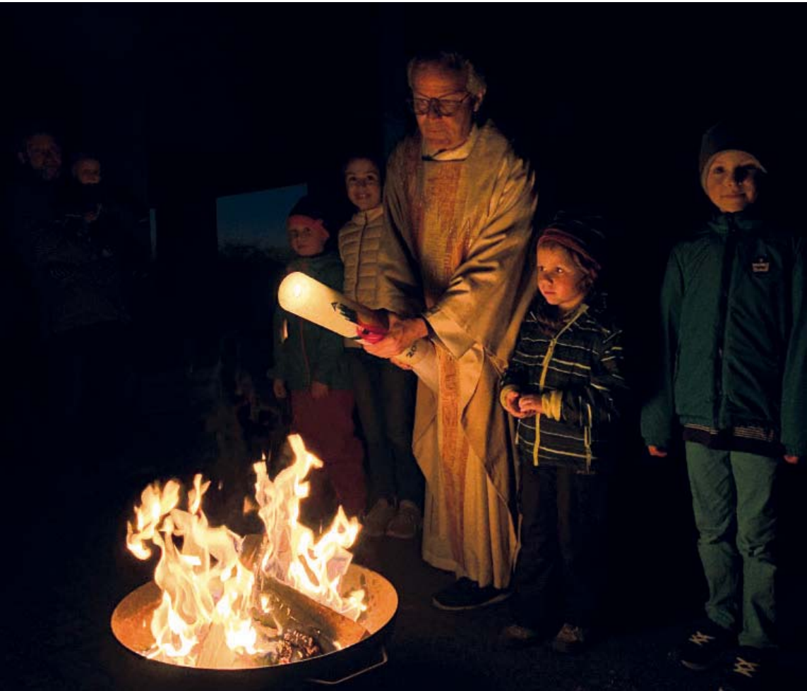
Zu Beginn der Osternacht wird die Osterkerze am Feuer entzündet

Der schönste und wichtigste Gottesdienst im ganzen Jahr, die Auferstehungsfeier in der Osternacht, beginnt an einem lodernden Feuer vor der Kirche. Feuer schafft Wärme, ermöglicht Leben. Schon bei den Germanen war es Sitte, das Herdfeuer nie ausgehen zu lassen; es sollte nicht nur wärmen, sondern auch die bösen Geis-