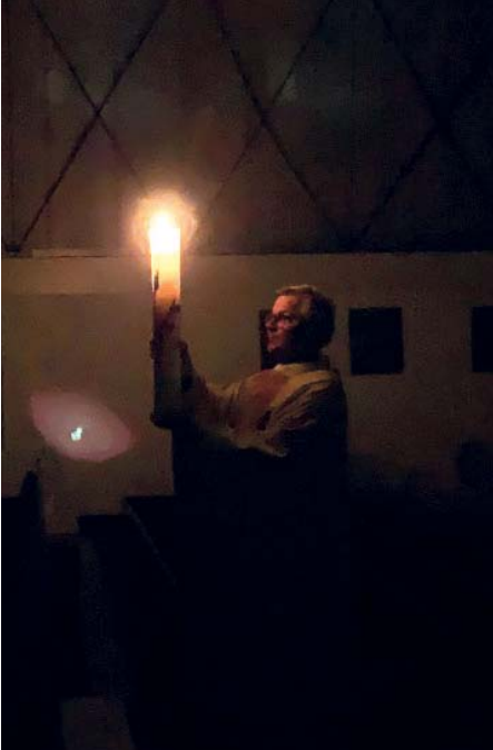
Das Osterlicht wird in die stockdunkle Kirche getragen

An diesem Osterfeuer wird dann die Osterkerze entzündet. Auch sie erinnert an die Feuersäule, die dem Volk Israel den Weg aus der Knechtschaft und dann durch die Wüste zeigt (Busch Exodus). Sie steht das ganze Jahr über für die Gegenwart Christi in unseren Kirchen. Mit dem feierlichen, dreimaligen „Lumen Christi“ - „Christus ist das Licht“ wird sie in die stockdunkle Kirche getragen. Dann wird das Licht an die kleinen Osterkerzen der Gemeinde weitergegeben: Wir haben unser Lebenslicht, unsere Lebensenergie von Gott. Die Kirche und unser Leben wird hell durch das warme Licht dieser vielen Osterkerzen.