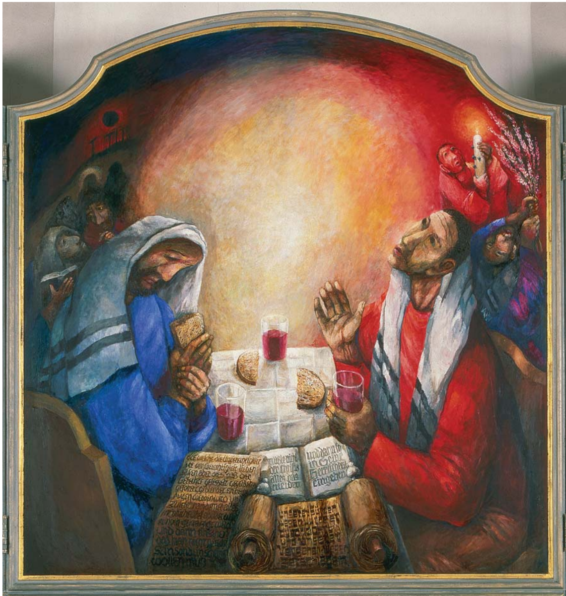
Sieger Köder, Emmaus, Rosenberger Altar © Sieger Köder-Stiftung Kunst und Bibel, Eilwangen www.verlagshgruppe-patmos.de/rights/abdrucke