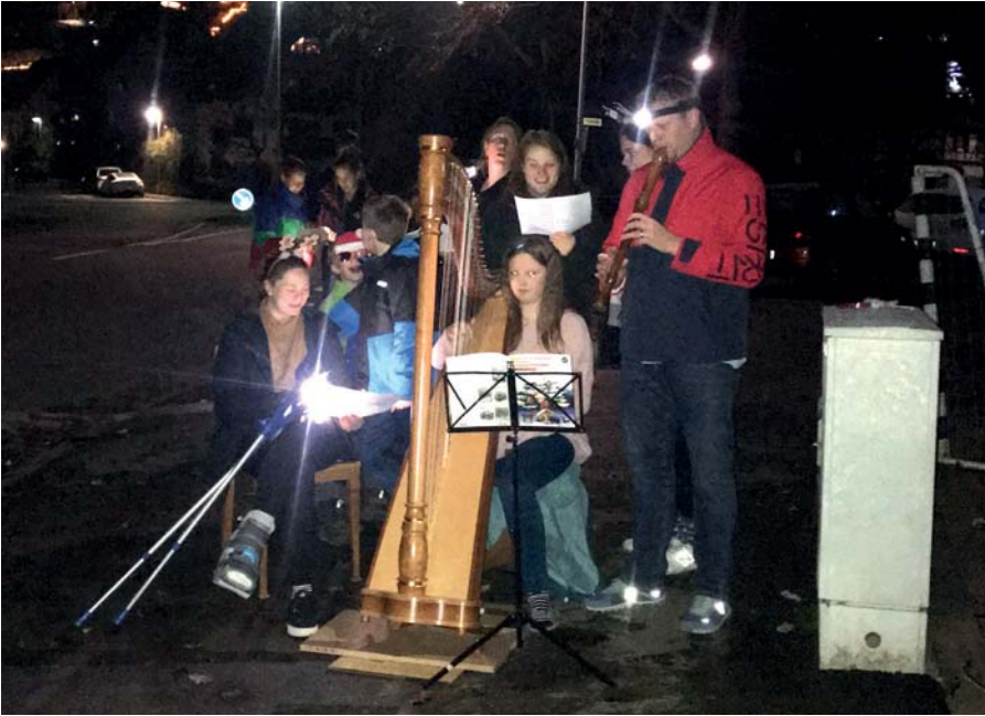
Weihnachtliches Singen vor der Haustür