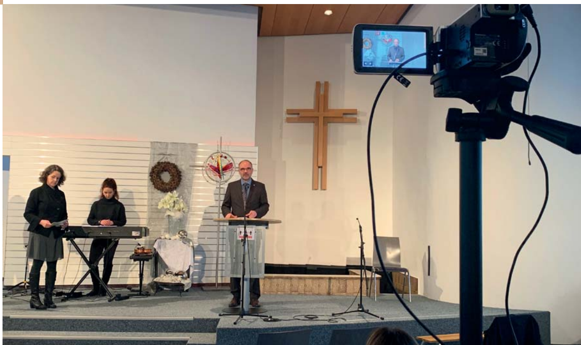
Per Kamera wird der ökumenische Gottesdienst übertragen.