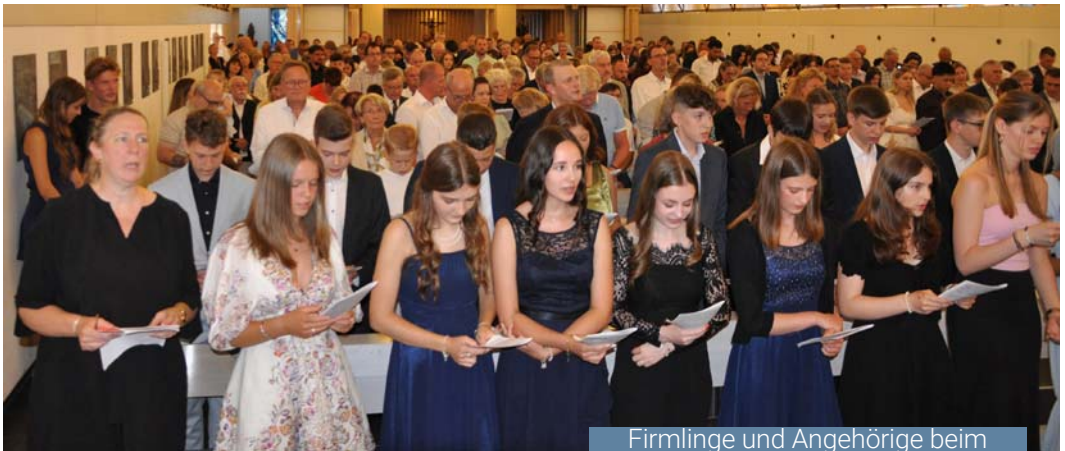
Firmlinge und Angehörige beim Gottedienst zur Feier der Firmung