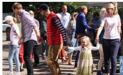
Kreistänze aus aller Welt fanden großen Zuspruch