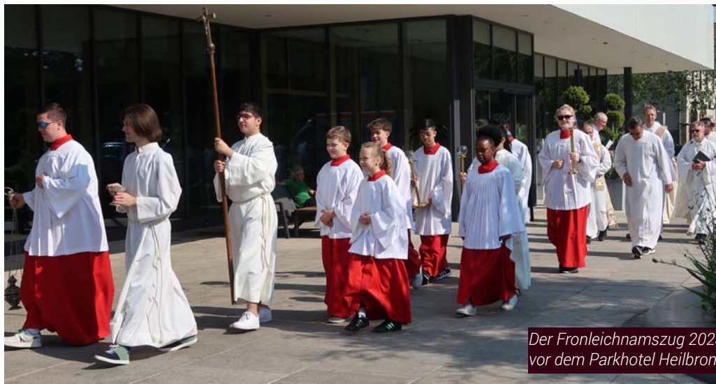
Der Fronleichnamszug 2023 vor dem Parkhotel Heilbronn