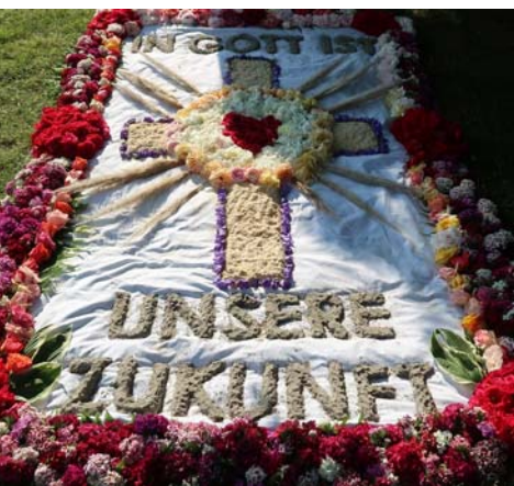
Die Gemeinde im Stadt- garten vor dem Parkhotel