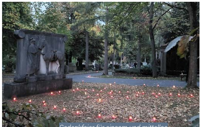
Gedenkfeier für einsam und mittellos Verstorbene auf dem Heilbronner Hauptfriedhof am 17. Oktober 2023