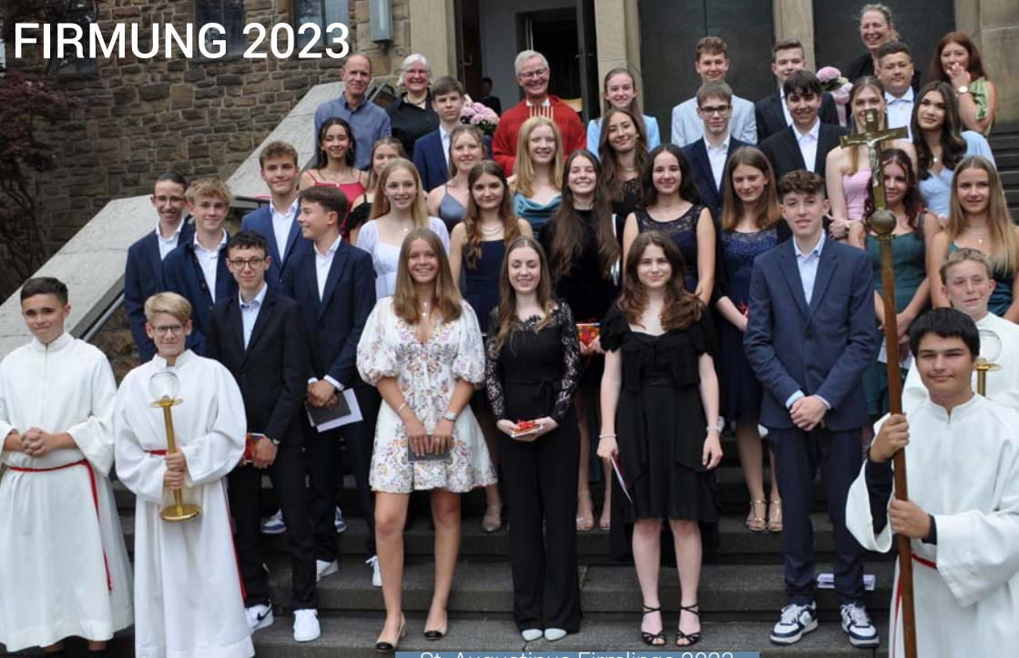
St. Augustinus Firmlinge 2023