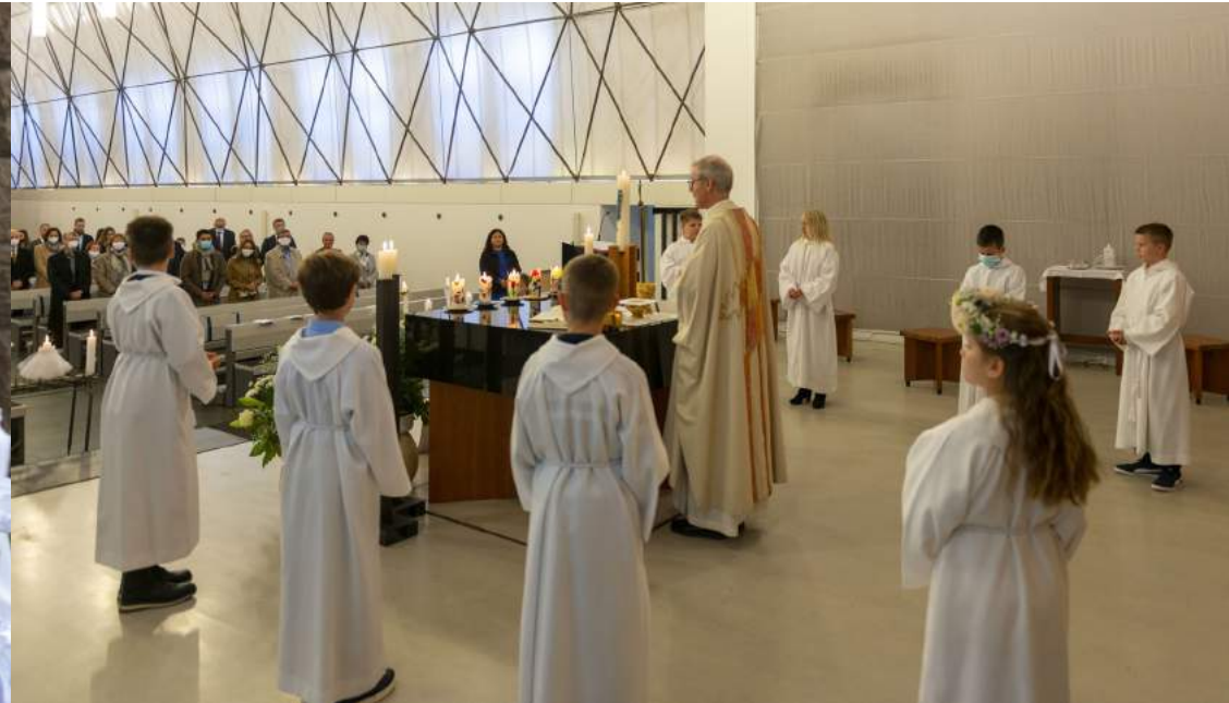
Die Kinder in kleiner Gruppe und mit Abstand um den Altar.

Die Erstkommunion 2020 konnte dieses Jahr leider nach Ostern nicht stattfinden und musste verschoben werden. Immer noch während Einschränkungen feierten wir insgesamt vier sehr schöne und feierliche Erstkommunion-Gottesdienste, zwei fanden vor den Sommerferien statt, am 25. Juli, und zwei im Herbst, am 10. Oktober, jeweils um 9.30 Uhr und 11.30 Uhr. Nach längerer Pause waren unsere Erstkommunionkinder und deren Familien froh und dankbar, dass wir dieses besondere Ereignis der Erstkommunion unter dem Motto: „Jesus, erzähl uns von Gott“, feiern durften.