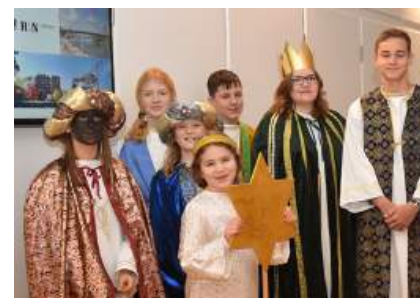
Casper, Melchior, Baltasar

Die Sternsinger stellen die heiligen drei Könige aus dem Morgenland dar.