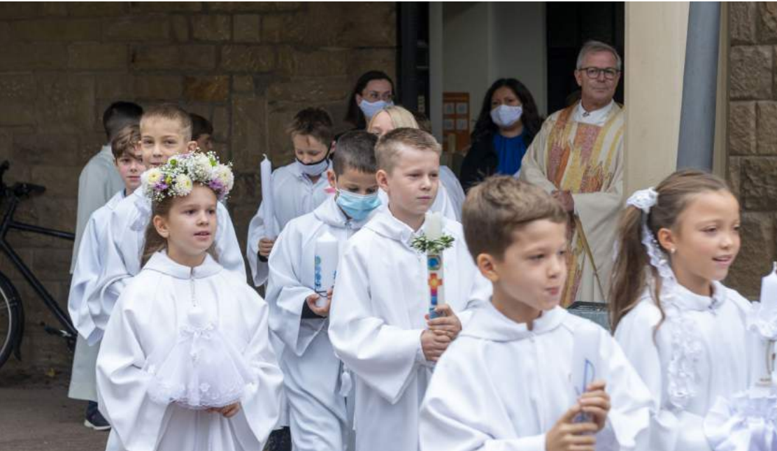
Gespannte Kinder beim feierlichen Einzug vor dem Gottesdienst