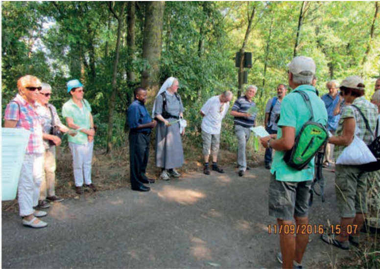
Die Pilgergruppe macht Station zum Thema des Heiligen Josefs

Am letzten Sonntag in den Sommerferien pilgern wir stets in eine der benachbarten Gemeinden. Dieses Jahr war unser Ziel die St.-Josefs-Gemeinde in Weinsberg. Am 11. September starteten rund 20 Wander-Pilger um 14.00 Uhr in unserer St. Augustinuskirche. Bei herrlich warmem Sommerwetter die Armsündersteige hoch, hatten wir am Waldrand mit Blick auf ganz Heilbronn die erste Station: „Josef: Flüchtling nach Ägypten“. Die zweite Station, kurz vor Weins-