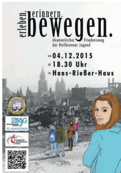
Plakat zum Friedensweg 2015