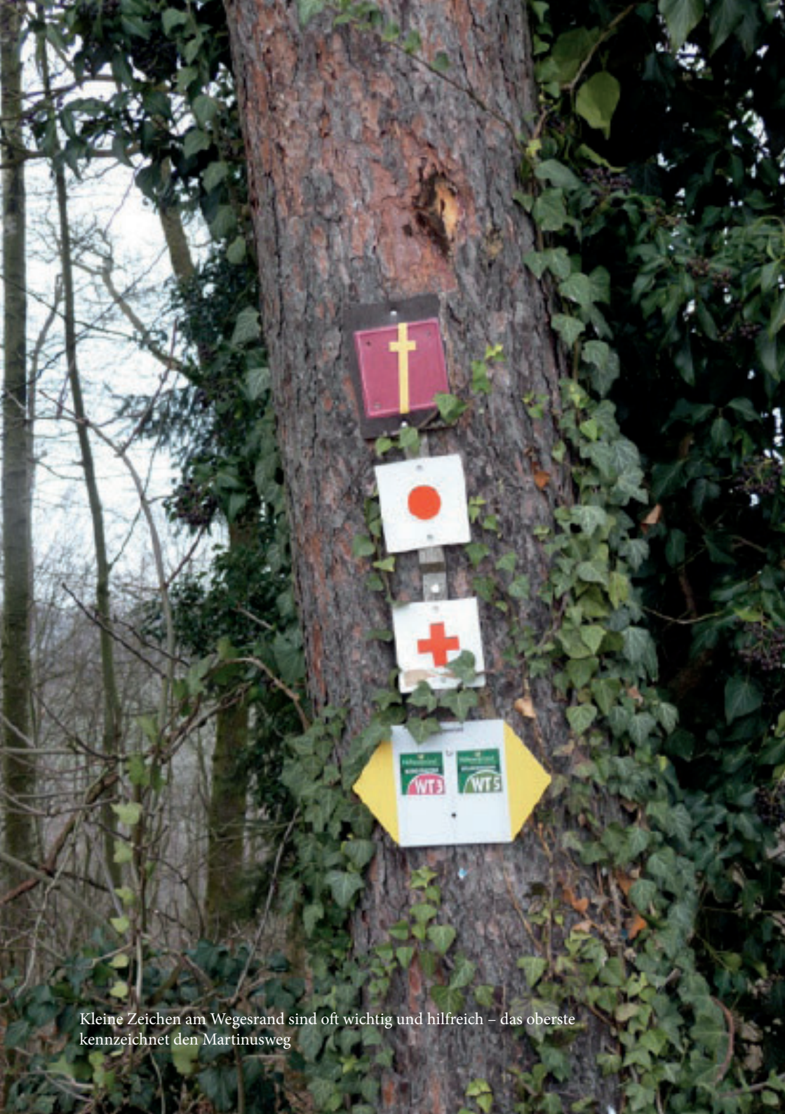
Kleine Zeichen am Wegesrand sind oft wichtig und hilfreich – das oberste kennzeichnet den Martinusweg