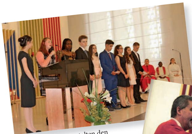
Die Jugendlichen gestalten den Gottesdienst lebendig mit