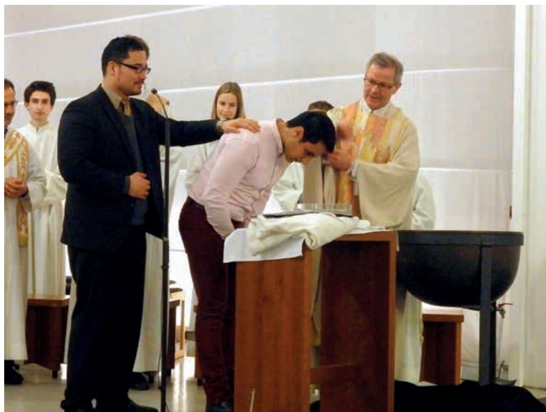
Bei der Taufe steht der Pate bewusst hinter dem Täufling