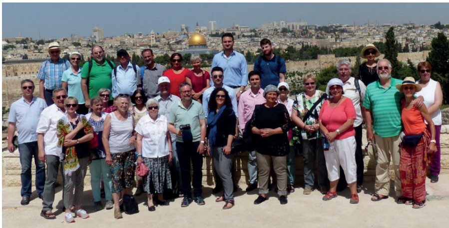
Unsere Pilgergruppe vor Jerusalem mit dem Felsendom (goldene Kuppel)