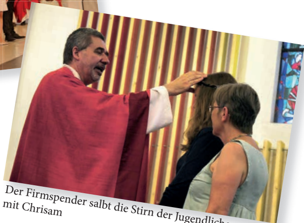
Der Firmspender salbt die Stirn der Jugendlichen mit Chrisam