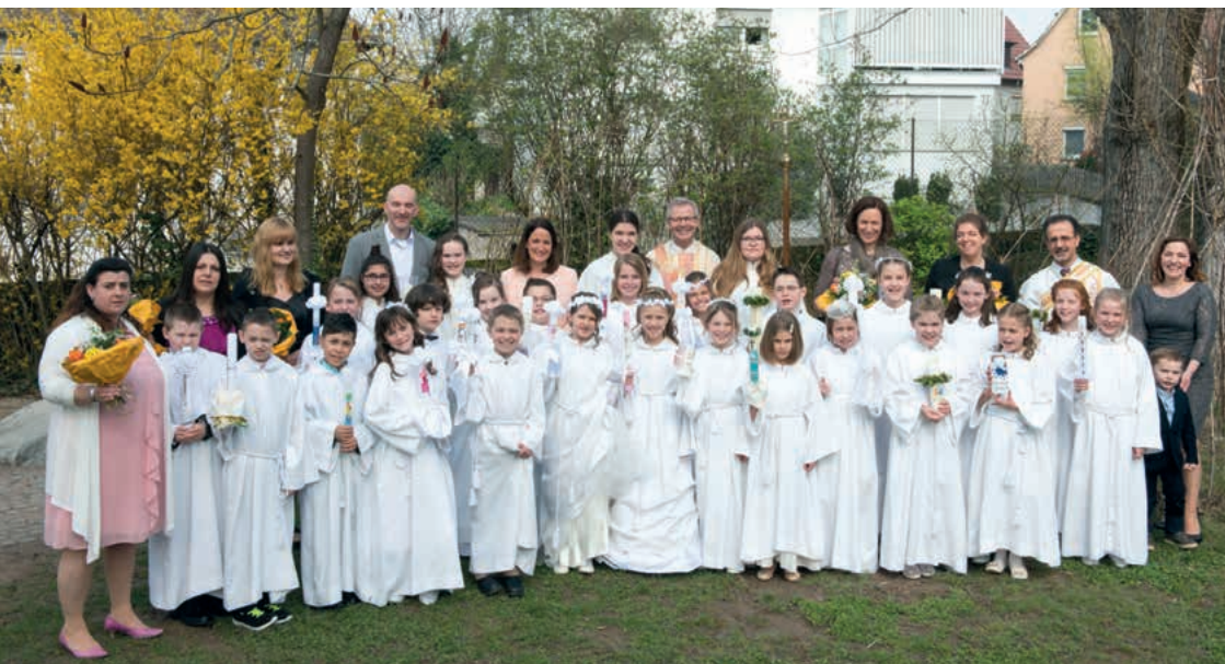
Nach der feierlichen Erstkommunion am 10. April 2016