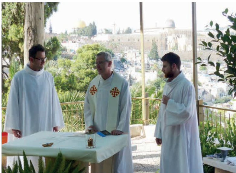
Eindrucksvoller Gottesdienst im Freien mit Blick auf Jerusalem