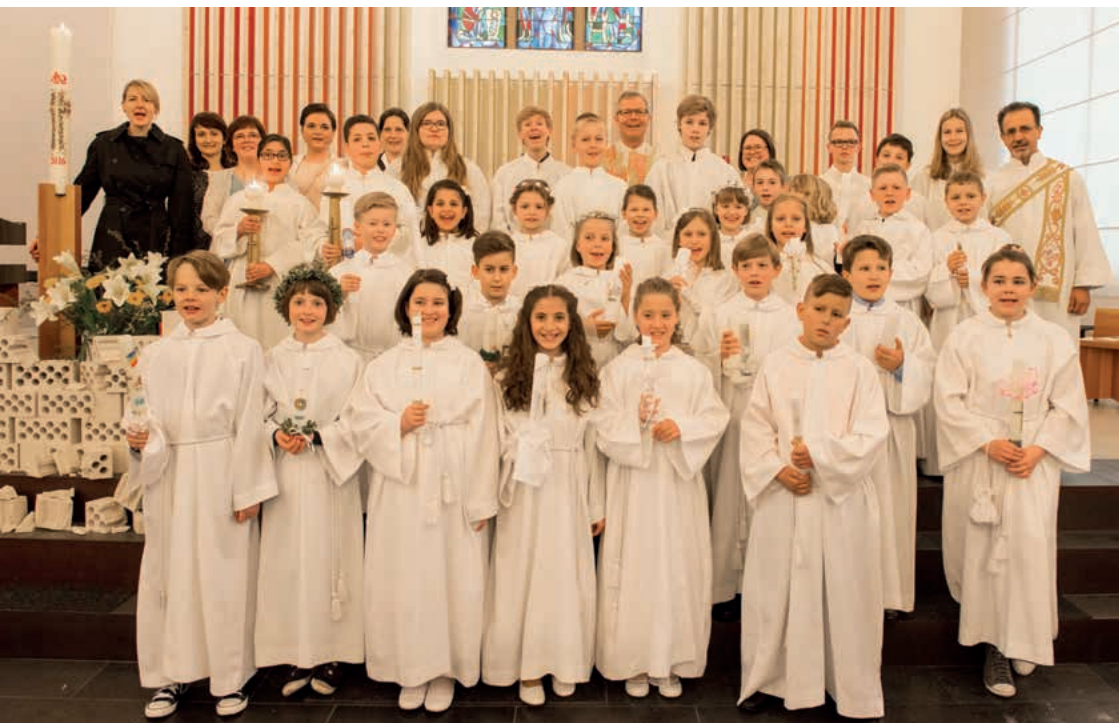
Nach der feierlichen Erstkommunion am 17. April 2016